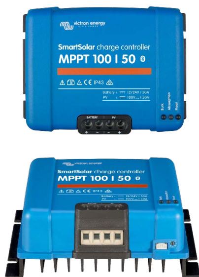
Contrôleur de charge SmartSolar MPPT 100/50